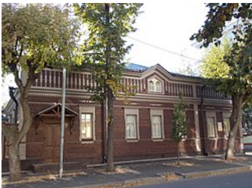
Дом Ф. Яруллина